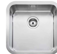
Fregadero Roca Berlín 55