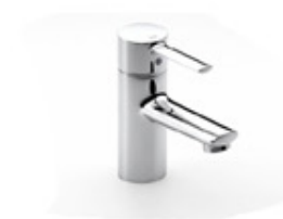
Grifería Baños Modelo Targa