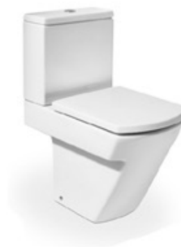
WC Baños Modelo Hall