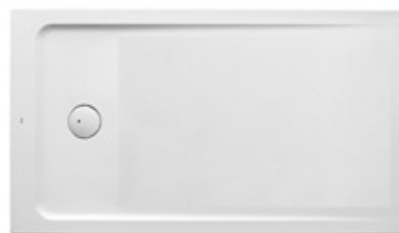
Ducha baño 2 Modelo Neo Daikiri