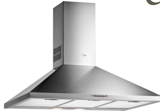
Campana Extractora Teka