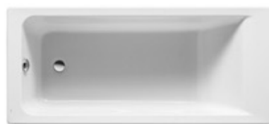
Bañera baño 1 Modelo Easy