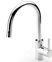
Grifería Roca Targa