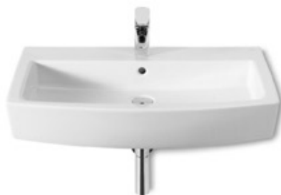
Lavabo Baños Modelo Hall