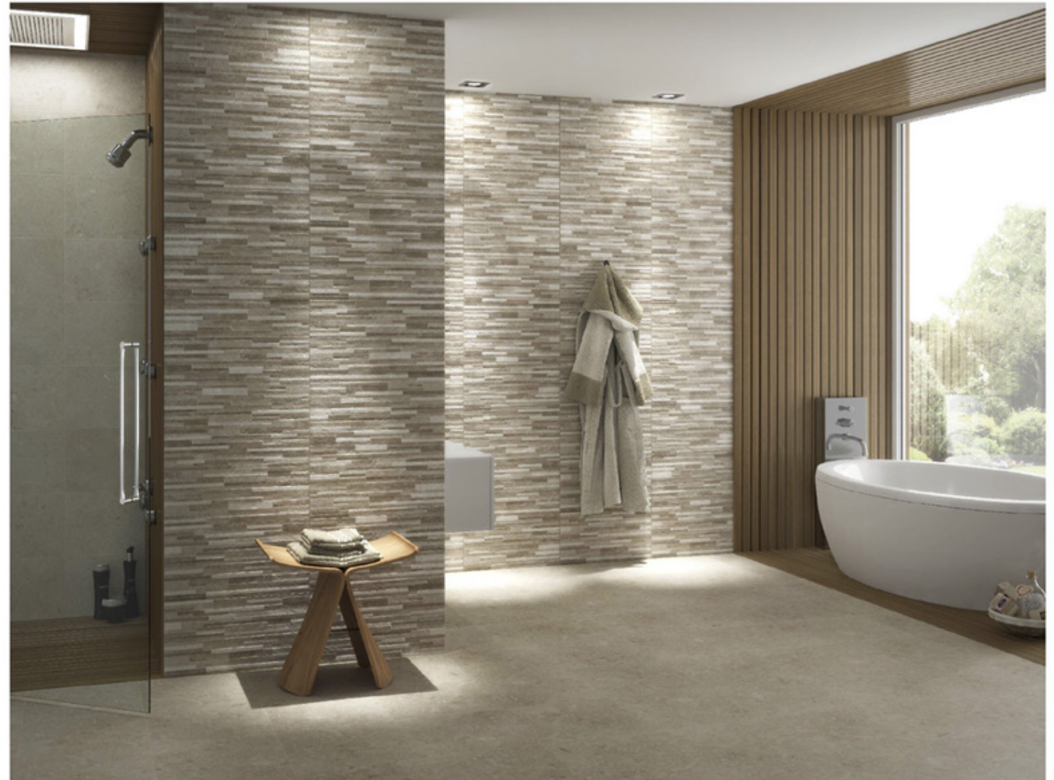
Ambiente Baño 3 Modelo Gard de Saloni